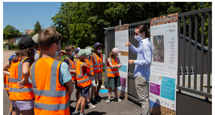
Les élèves attentifs tout au long de la visite

Le réchauffement climatique est plus que jamais d'actualité et concerne toutes les générations. La visite d'une telle installation est l'occasion de sensibiliser les générations futures à l'importance d'un mix énergétique varié. Rappel des objectifs de la programmation pluriannuelle de l'énergie (PPE), présentation des productions d'énergies renouvelables et comparatif de production ont permis de replacer la construction du réseau de chaleur de Saulieu dans un contexte plus large de transition énergétique. Un moyen de montrer aux élèves que chacun, à son niveau, peut y contribuer. Et pourquoi pas, susciter des vocations.